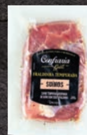
Fraldinha suína temperada Confraria Grill kg