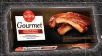
Costela com molho barbecue Seara 1 kg

Os benefícios da carne suína são muitos. Ela é rica em fósforo, vitamina B12, ferro e potássio e os cortes magros ainda têm quantidade menor de gordura se comparados aos de outros animais. O ideal é preparar a carne de modo que fique macia e ainda úmida por dentro – não havendo necessidade de deixar esturricar os filés. Para dar ainda mais sabor aos cortes, prepare-os na grelha. No caso de picanha, basta cortá-la em filés, pincelar azeite e deixar cozinhar por 4 minutos de cada lado, na grelha previamente aquecida. Mas, se a escolha é por costela, marine a peça de um dia para o outro com os temperos de sua preferência (como alecrim, vinho, cebola). Passadas 12 horas, retire a peça da marinada, envolva-a em papel-alumínio e leve para assar na brasa por cerca de 2 horas, virando sempre. Após o cozimento, retire o alumínio e asse por mais alguns minutos até dourar. A linguiça já é velha conhecida da brasa e pede atenção apenas para ser virada constantemente para assar por igual de todos os lados.