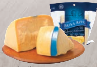
Queijo parmesão Faixa Azul 100 g