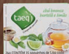
Chá-branco Taeq hortelã e limão com 15 envelopes 24 g