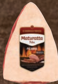
Picanha bovina resfriada Maturatta kg