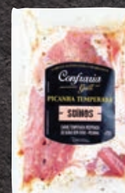
Picanha suína resfriada Confraria Grill kg