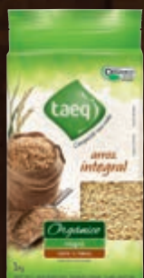
Arroz integral orgânico Taeq tipo 1 - 1 kg