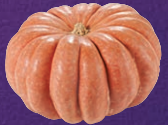
Abóbora-moranga a granel kg

Existem várias hipóteses para o surgimento do Halloween, porém a ideia mais difundida é de que a festa teve início com o Samhain, festival de Irlanda, Escócia e Ilha de Man, que celebrava o Ano-Novo celta. Acreditava-se que, nessa ocasião, as almas dos mortos retornavam a suas casas para visitar os familiares e buscar o calor das lareiras e alimento. No Brasil, a data recebeu o nome de Dia das Bruxas e é celebrada com festas a fantasia, e rostos feitos de abóbora e iluminados por velas. Para fazer a comemoração, enfeite a casa com abóboras desenhadas e bruxas e faça uma mesa apenas de doces em potinhos coloridos para que os convidados possam experimentar um pouco de todos, e disponha na mesa bombons, servidos na própria embalagem. Aproveite a ocasião para fazer uma comemoração regada a doçuras e travessuras.