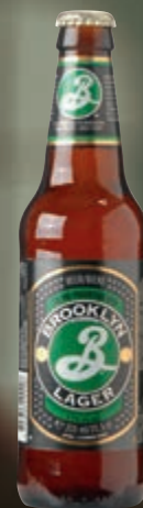
Cerveja americana Brooklyn lager long neck 355 ml