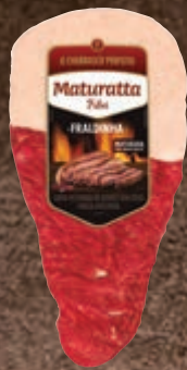
Fraldinha bovina resfriada Maturatta kg

Para acender a brasa de modo prático: monte um cone com os pedaços maiores de carvão e, dentro dele, coloque papel e, por fim, o fogo.