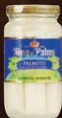
Palmito orgânico King of Palms 180 g