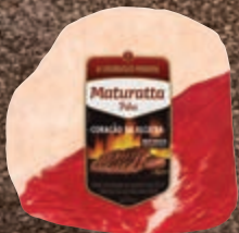
Coração da alcatra bovina resfriado Maturatta kg