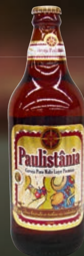
Cerveja brasileira Paulistânia garrafa 600 ml