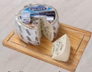
Queijo gorgonzola Quatá 100 g