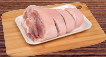
Joelho suíno resfriado kg