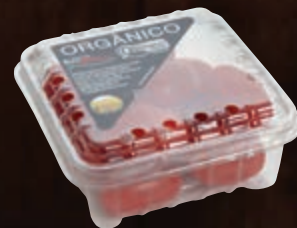
Tomate orgânico sweet grape 180 g

O programa é uma iniciativa circular que consegue inserir novamente no sistema produtivo embalagens que são descartadas nas Estações de Reciclagem Pão de Açúcar Unilever. O fornecedor de embalagens compra o papel das cooperativas parceiras e transforma o material em novas caixas e pacotes de mais de 40 produtos de marcas exclusivas (Taeq e Qualità). Em 2015, foram mais de 1.700 toneladas de papel reciclado. O produtos feitos com papel reciclado têm o logo do programa Novo de Novo.