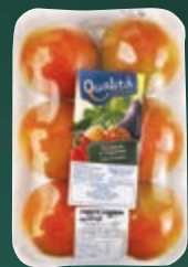
Tomate-carmem Qualidade 600 g