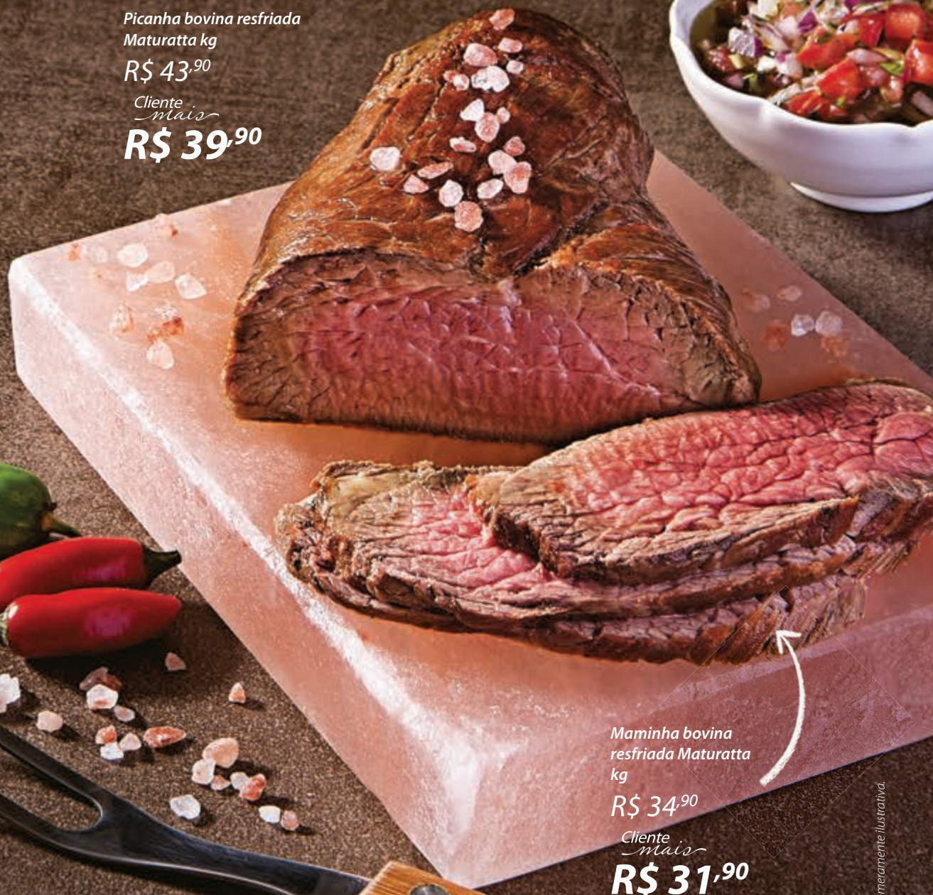
Maminha bovina resfriada Maturatta kg