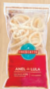
Lula em anéis congelada Frescatto 400 g

MOLHO DE IOGURTE – Bata todos os ingredientes liquidificador e sirva na sequência.