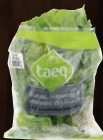
Rúcula orgânica Taeq unidade