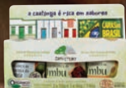
Kit de geleias da caatinga Caras do Brasil 146 g