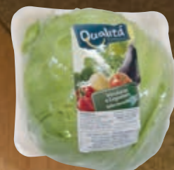
Alface-americana bola embalada Qualitá unidade