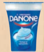
Iogurte Danone vários sabores 170 g