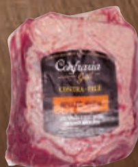
Contrafilé Confraria Grill kg