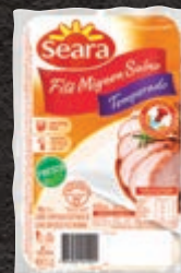
Filé-mignon suíno temperado resfriado Seara kg