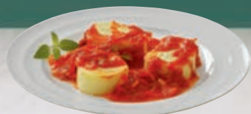
Rondelli de queijo ao molho cassé 100 g

Itens sujeitos à disponibilidade de estoque. Verifique o estoque disponível na loja Pão de Açúcar mais perto da sua casa. Consulte a relação de lojas no site www.paozacucar.com.br