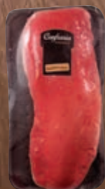
Lagarto de novilho bovino Confraria Gourmet kg