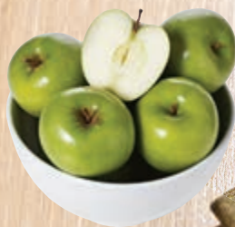
Maçã granny smith a granel kg