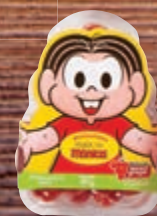
Tomate sweet grape 180 g