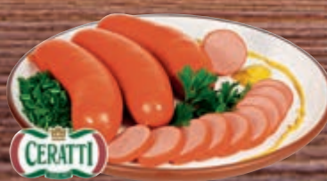
Salsicha viena Ceratti kg