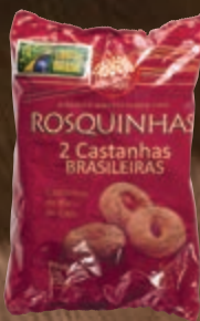
Rosquinhas amanteigadas com castanhas de baru e caju Caras do Brasil 250 g