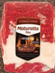
Entrecôte (ponta do contrafilé) bovino resfriado Maturatta kg