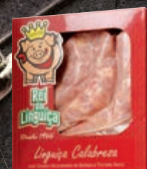
Linguiça calabresa com mussarela de búfala Rei da Linguiça kg

Por ser versátil, a carne suína aceita muito bem diferentes temperos. Aposte em barbecue para dar o toque defumado, em limão para levar o frescor e fazer salivar, ou em mel para trazer ao preparo um toque agrídoce. A quem não dispensa uma boa pimenta, aposte na do-reino moída na hora, ou na biquinho. Se preferir brincar com as sensações, sirva com geleia de pimenta.