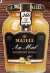
Mostarda francesa Maille met honing 230 g