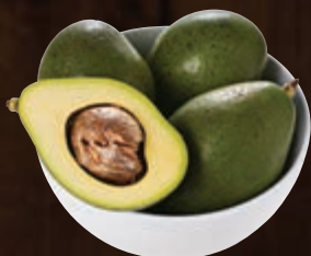
Abacate a granel kg