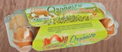
Ovo caipira orgânico Label Rouge com 10 unidades