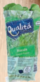
Rúcula embalada Qualitá unidade