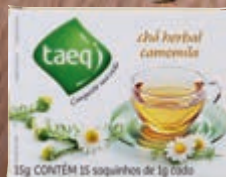
Chá de camomila Taeq com 15 envelopes 15 g