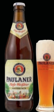
Cerveja alemã Paulaner Hefe-Weissbier garrafa 500 ml