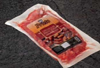
Linguiça de pernil Prieto 600 g