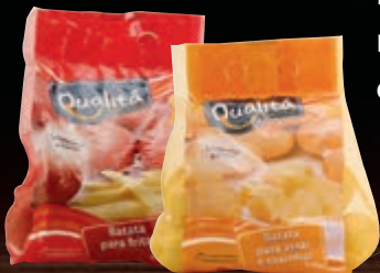
Batata para assar, cozinhar ou fritar Qualitá 1,5 kg