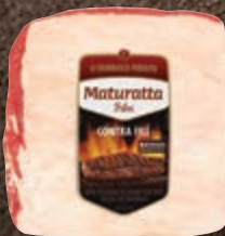
Contrafilé bovino resfriado Maturatta kg