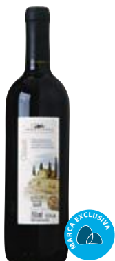
Vinho italiano tinto Club des Sommeliers chianti 750 ml Cliente Mais R$ 36,90