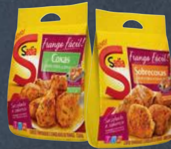
Coxa ou sobrecoxa de frango temperadas congeladas Sadia Frango Fácil 800 g Cliente Mais R$ 9,89 cada