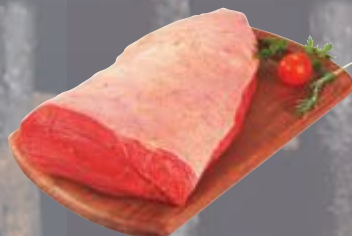
Picanha bovina resfriada extralimpa kg Cliente Mais R$ 49,90