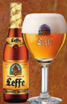
Cerveja belga Leffe Blonde garrafa 330 ml Cliente mais R$ 8,90

Peixes e frutos do mar: cervejas Munich Helles Lager, Saison/ Farmhouse Ale e Witbier. Ou ainda American Blonde Ale (bacalhau), Bière de Champagne, Bière Brut, Bière de Garde (salmão) e Witbier.