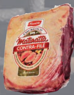
Contrafilé bovino resfriado Maturatta Swift kg Cliente Mais R$ 33,90