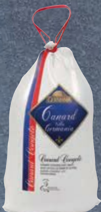
Pato canadense congelado Canard Villa Germania kg Cliente Mais R$ 20,89