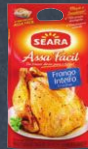
Frango Assa Fácil Seara kg Cliente Mais R$ 8,99

No caso do peru e do pato, o chef indica o cozimento no forno por se tratar de carnes mais duras. O peito dessas aves, assim como do chester, até pode ir na grelha, desde que preparado com a pele. Para dar um toque final e umedecê-las, use um molho pronto ou um preparado na hora.