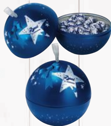
Chocolate Baci Xmas blue ball 329 g Cliente mais R$ 13,90 cada