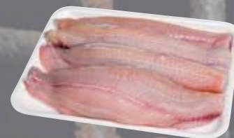
Filé de pintado fresco kg Cliente Mais R$ 49,90