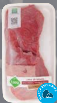
Fraldinha bovina resfriada Taeq kg Cliente Mais R$ 25,99

Vegetais: corte abobrinha, berinjela e tomate em rodela de cerca de 0,5 cm, e cogumelos porto belo e shiitaki (ambos sem a base) temperados com sal refinado e azeite. “Mantenha a altura da grelha baixa e cozinhe cada lado por 5 minutos ou até que o vegetal esteja macio”, revela Vieira.