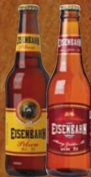
Cerveja brasileira Eisenbahn Pilsen ou Strong Golden Ale long neck 355 ml Cliente mais R$ 5,49 cada