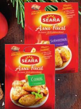
Coxa ou sobrecoxa de frango Assa Fácil Seara 800 g Cliente Mais R$ 9,69 cada