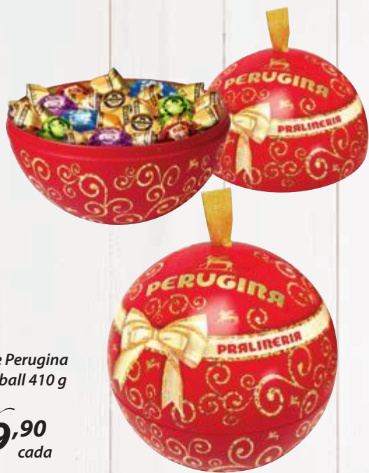
Chocolate Perugina Xmas red ball 410 g Cliente mais R$ 9,90 cada

Sabia que nossas lojas Pão de Açúcar recebem novos itens nacionais e importados toda semana? Venha conferir de perto!