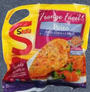
Filé de peito de frango temperado Sadia Frango Fácil 700 g Cliente Mais R$ 11,99