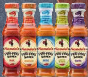
Molho Peri-Peri Nando's vários tipos 125 ml Cliente Mais R$ 14,90 cada