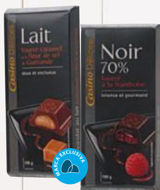
Chocolate com recheio de caramelo ou 70% com framboesa Casino Délices 100 g Cliente mais R$ 13,90 cada