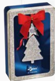
Chocolate Baci Xmas 143 g Cliente mais R$ 46,90