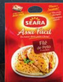
Filé de peito de frango Assa Fácil Seara 800 g Cliente Mais R$ 11,79