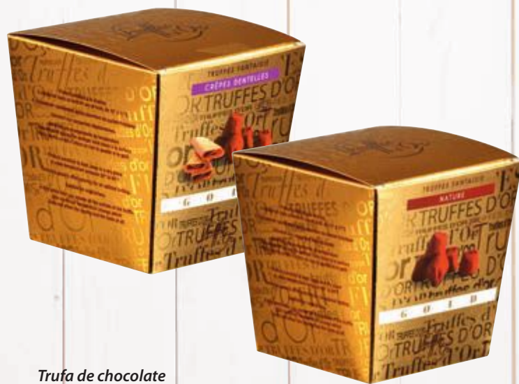
Trufa de chocolate Truffes d'Or Mathez 150 g Cliente mais R$ 15,90 cada

Cliente Mais é o participante do programa de relacionamento do Pão de Açúcar. Os acessórios mostrados nas fotos não fazem parte das ofertas e as imagens dos produtos não precificadas são meramente ilustrativas. Itens sujeitos à disponibilidade de estoque. Verifique o estoque disponível na loja mais perto de sua casa. Consulte a relação de lojas no site: www.paodeacucar.com.br . Ofertas válidas para todas as Lojas Pão de Açúcar do Estado de São Paulo. Validade: 19 a 25/11/2015. Parte integrante da Revista Veja, edição 2.453, mês de novembro. Não pode ser vendida separadamente.